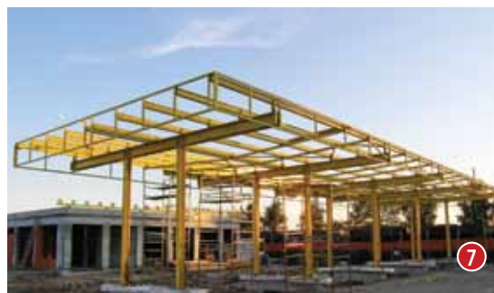
Slika 1 HAK, Stanica za tehnički pregled, Varaždin